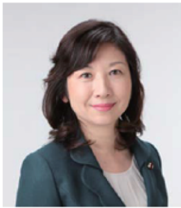
野田 聖子 先生

衆議院議員 総務大臣・女性活躍担当大臣・ 内閣府特命担当大臣 慢性の痛み対策議員連盟 会長